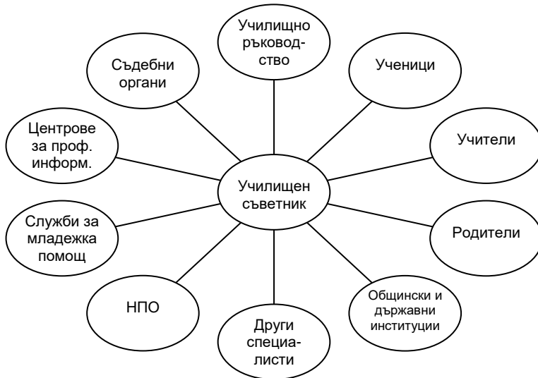
Фигура 5 Взаимодействие на училищния съветник

В някои страни, като Ирландия, Обединеното кралство, САЩ, от училищните съветници се очаква да взаимодействат и с координатори за прием във висши училища, местни енорийски свещеници, представители на местния бизнес. В Малта пък се изисква координация със службите за подкрепа на бременни и майки в ученическа възраст. Специфично за Обединеното кралство е взаимодействието между училищния съветник и вътрешноучилищната пасторална система.